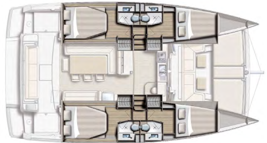
4 CABINS / 4 HEADS VERSION VERSION 4 CABINES / 4 SDB